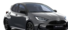
Bi-Tone Gri inchis (1M2) si Negru (202)* (M29)