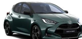
Bi-Tone Verde forest (6X7) si Negru (202)* (M39)