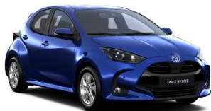
Albastru ienupar* (8Y8)