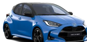
Bi-Tone Albastru Neptun (8T6) si Negru (202)* (M19)