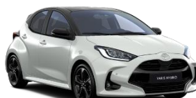
Bi-tone Alb perlat (089) si Negru (209)** (2PU)