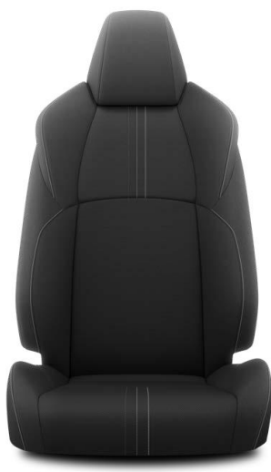
Stofa neagra cu cusatura gri (FD20)