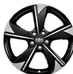
Jante din aliaj de 17" negre, cu aspect forjat (5 spite duble)