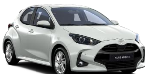
Alb perlat** (089)