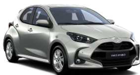
Gri deschis* (1K3)