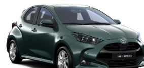
Verde forest* (6X7)