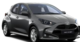
Gri inchis* (1M2)