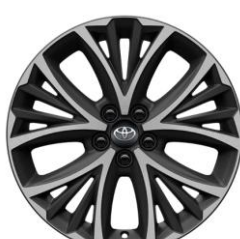
Jante din aliaj de 17" negre, cu aspect forjat (10 spite duble)