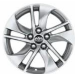
Jante din aliaj de 15" argintii (5 spite duble)