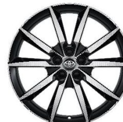
Jante aliaj 18" negre cu aspect forjat (10 spite)