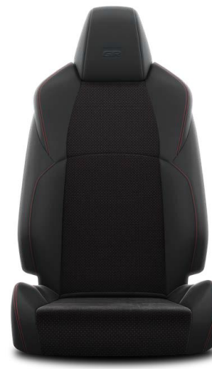
Piele intoarsa + partial piele (EB20)