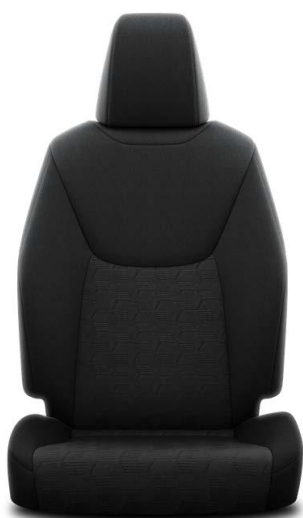
Stofa neagra (FB20)