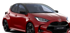
Bi-Tone Rosu aprins (3U5) si Negru (209)** (2SZ)