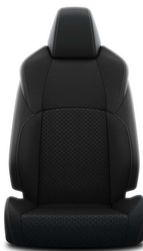
Stofa neagra + partial piele (EA20)