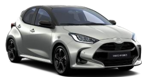
Bi-Tone gri deschis (1K3) si Negru (202)* (2TH)