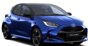
Bi-Tone Albastru ienupar (8Y8) si Negru (202)* (M20)