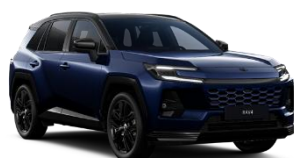
Albastru inchis/ Negru*** (M40)