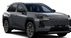
Gri inchis* (1L6)