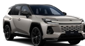
Bronz/ Negru*** (2SQ)