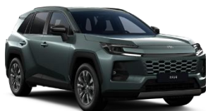
Verde inchis* (6X7)