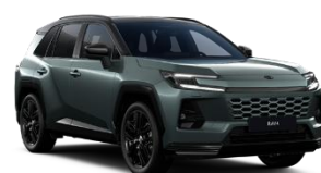
Verde inchis/ Negru*** (M39)