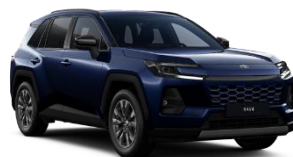
Albastru inchis* (8X8)