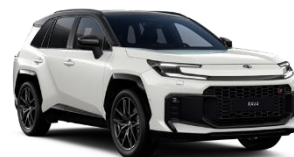
Alb platinum perlat/ Negru*** (2VP)