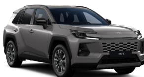
Gri antracit* (1M6)