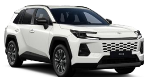
Alb Solid (040)