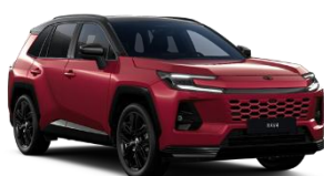
Rosu/ Negru*** (2NF)