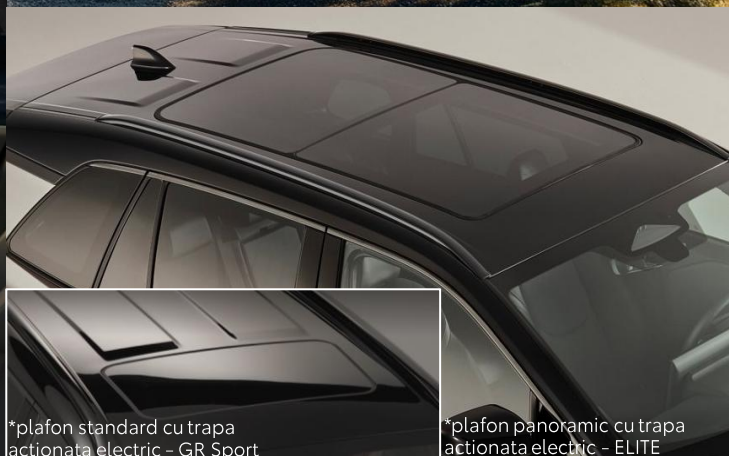
*plafon standard cu trapa actionata electric – GR Sport