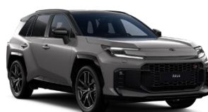
Gri antracit/ Negru*** (M38)