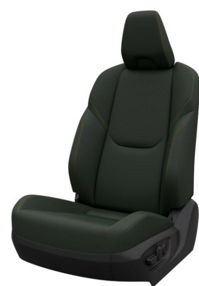
Tapiterie din piele Overland khaki (LH60)