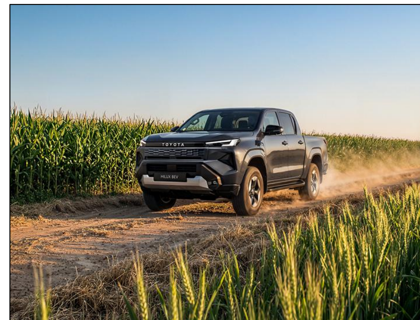
Imagini cu titlu de prezentare

NOTA: Preturile de lista reprezinta preturi de vanzare recomandate. Preturile in lei se vor calcula conform cursului de schimb al retailerului de la care se face achizitia. Preturile afisate includ Pachetul legislativ obligatoriu (trusa medicala, triunghi reflectorizant, extingtor). Toyota Romania isi rezerva dreptul de a modifica prezenta lista de preturi ca urmare a unor erori, modificari structurale sau in urma unor comunicari din partea producatorului, fara nicio informare prealabila. Pentru a obtine o oferta de actualitate, este necesar sa va adresati unui consultant de vanzari Toyota. Lista de dotari constituie o selectie a celor mai importante dintre acestea, lista completa a dotarilor fiind disponibila pe website-ul www.toyota.ro .