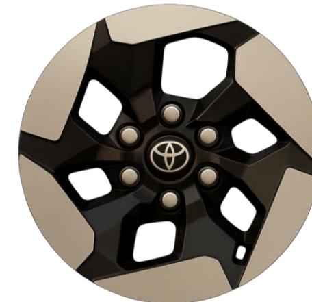
STYLE & EXECUTIVE BEV