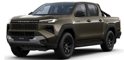
Bronz * (6X1)