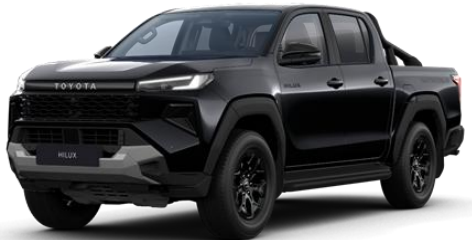
Negru * (218)