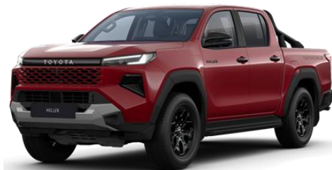
Rosu * (3T6)