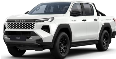
Alb Platinum ** (089)