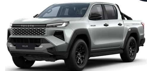
Argintiu * (1D6)