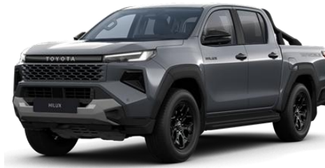
Gri inchis * (1M2)