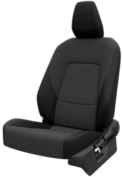
Tapiterie din stofa neagra (FC20)