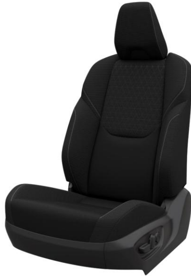
Tapiterie din stofa neagra (FD20)