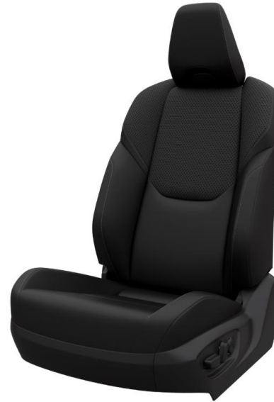
Tapiterie din piele partiala neagra (LA20)