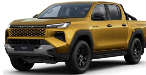
Galben * (5C7)