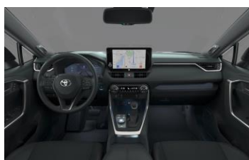
Piele sintetica neagra/Plafon negru/cusatura rosie (EC20)