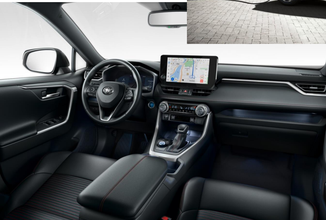
Imagini cu titlu de prezentare